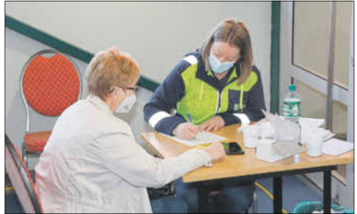
Nicole Golz hilft beim Ausfüllen der Anamnesebögen

Die Erstimpfungen wurden am 29. und 30. März durchgeführt. Mitarbeiter der Bundeswehr, des Deutschen Roten Kreuzes, des Landkreises und Hausärzte aus dem Jerichower Land führten die Beratungen und Impfungen durch. Mitarbeiter der Gemeinde und der Feuerwehr Elbe-Parey kümmerten sich um den Empfang und einen entspannten und durchorganisierten Ablauf. Im Jugendhaus Parey wurde ein Versorgungs- und Pausenbereich für die Einsatzkräfte eingerichtet. Als es kurzfristig zu einem Engpass im Empfangsbereich kam, da viele zu Impfenden ihren Anamnese-Bogen nicht vorausgefüllt mitgebracht hatten, griff die Bürgermeisterin Nicole Golz kurzerhand zum Kugelschreiber und half den Bürgerinnen und Bürgern beim Ausfüllen der Fragebögen.