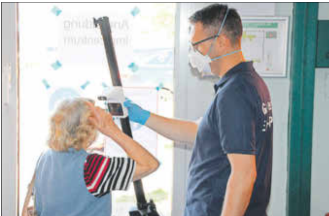
Temperaturmessung am Eingang