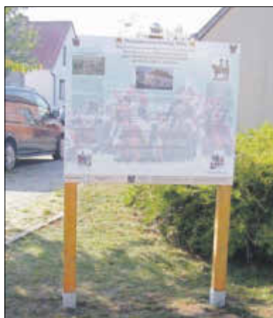
Infotafel in Jerichow

Vorgesehen ist der Platz am Rastpunkt an der Kreuzung Hauptstraße/ Bittkauer Weg in Parey. Mit dem Historienwanderweg wird der Marschweg beschrieben, den die Preußen 1806 unter General Fürst zu Hohenlohe nach der Schlacht bei Jena und Auerstedt nahmen, verfolgt von napoleonischen Truppen. Er führte unter anderem über Burg, Genthin, Rathenow, Neuruppin, Gransee, Fürstenberg, Lychen, Hardenbeck, Boitzenburg, Wichmannsdorf bis nach Prenzlau.