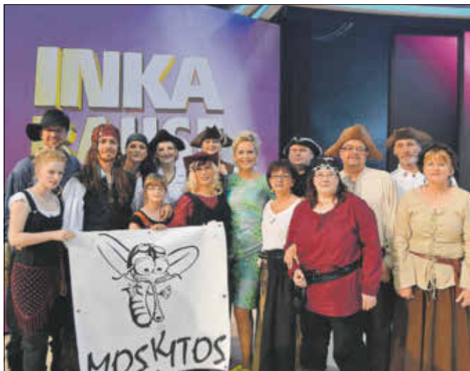
Fernsehauftritt 2013 beim MDR „Das Gold der Inka“

10 Jahre Moskito Club e. V., 10 Jahre - viele schöne Veranstaltungen – Elbauenfest und Vereinsfest in Parey, Kartoffelfest in Genthin, Brühtrogpaddeln in Roßdorf, Spargelfest in Hohenseeden, Tanz in den Mai und Weihnachtsmarkt in Parey, Landesgartenschau in Burg und viele viele mehr - zahlreiche selbstgebaute Themenparcours, ein Mammut, ein Piratenschiff, ein Segelboot, die Mühle, lustige Kostüme, kreative Flugobjekte, Tanz- und Bühnenshows - ein besonderer Fernsehauftritt bei Inka Bause neben Bonnie Tyler, Petro Lombardi und Maite Kelly – die „Moskitos“ haben schon einiges zusammen gestaltet und erlebt.