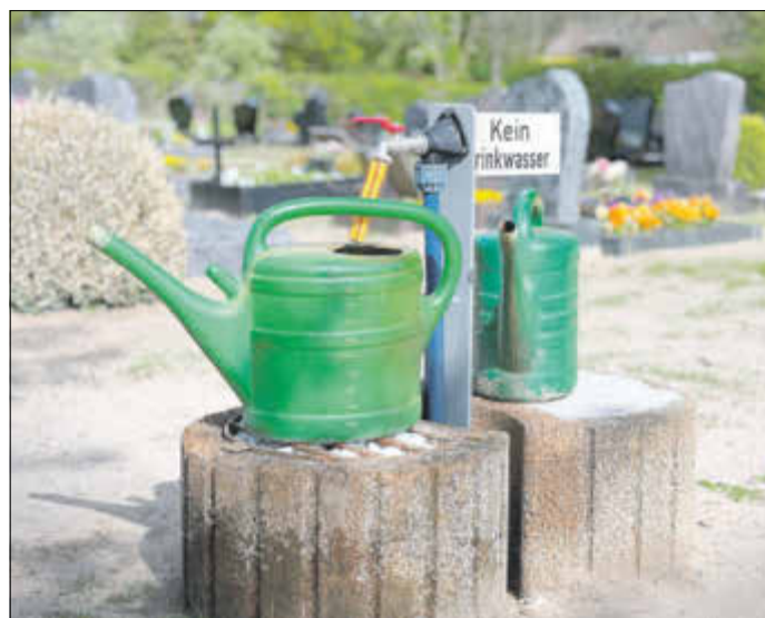
Friedhof Parey - Wasserentnahmestelle

Rasen gemäht. Aus gegebenem Anlass weisen wir erneut darauf hin, dass die Ablage von Grabschmuck an den anonymen und Rasenurnengräbern nur auf der dafür vorgesehenen gepflasterten Stelle zulässig ist. Ausnahmsweise dürfen zu Totensonntag und Allerheiligen kleine Grabgestecke, die die Namensplatte nicht überragen, auf den Platten der Rasenurnen abgelegt werden. Widerrechtlich abgelegter Grabschmuck stellt ein Hindernis bei den Mäharbeiten dar und wird entschädigungslos beraumt.