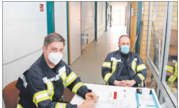
Unterstützung von der Feuerwehr Elbe-Parey