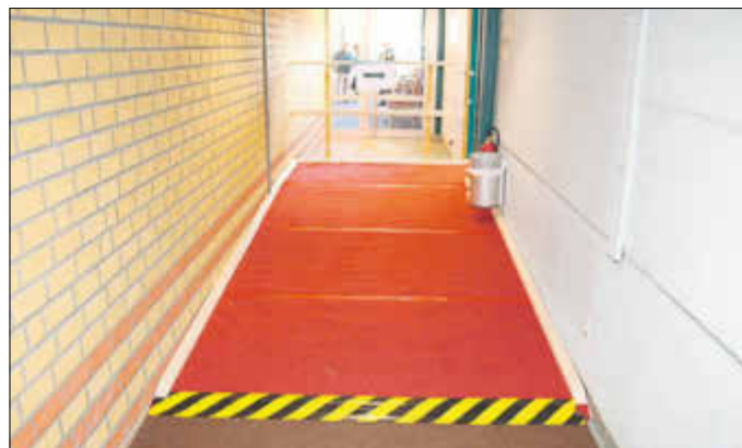
Barrierefreier Zugang in die Sporthalle