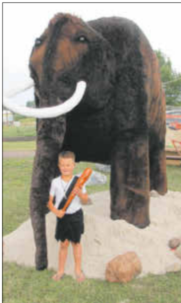
Elbauenfest 2013 - Motto „Bei den Feuersteinen“

10 Jahre Moskito Club e. V., 10 Jahre - viele schöne Veranstaltungen – Elbauenfest und Vereinsfest in Parey, Kartoffelfest in Genthin, Brühtrogpaddeln in Roßdorf, Spargelfest in Hohenseeden, Tanz in den Mai und Weihnachtsmarkt in Parey, Landesgartenschau in Burg und viele viele mehr - zahlreiche selbstgebaute Themenparcours, ein Mammut, ein Piratenschiff, ein Segelboot, die Mühle, lustige Kostüme, kreative Flugobjekte, Tanz- und Bühnenshows - ein besonderer Fernsehauftritt bei Inka Bause neben Bonnie Tyler, Petro Lombardi und Maite Kelly – die „Moskitos“ haben schon einiges zusammen gestaltet und erlebt.