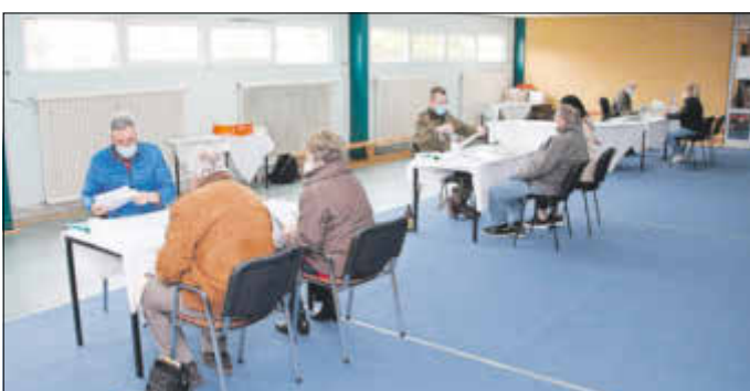
Beratungs- und Wartebereich