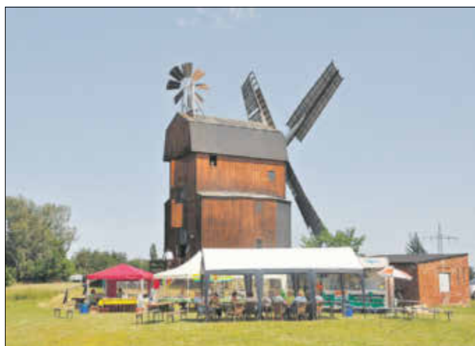
Mühltage 2014 mit dem Heimatverein Parey e. V.