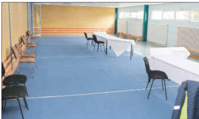
Beratungsbereich im Gymnastikraum