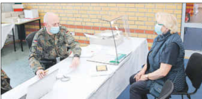
Mitarbeiter der Bundeswehr bei der Beratung