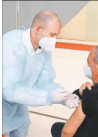
Facharzt der Bundeswehr beim Impfen