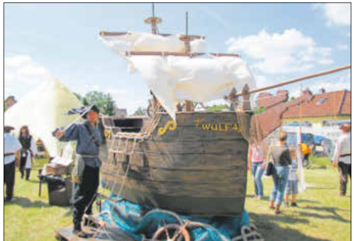
Brühtrogpaddeln in Roßdorf 2014

Im April 2011 wurde es beschlossen. Der Moskito Club e. V. wurde als gemeinnütziger Verein gegründet und ist bis heute ein fester Bestandteil des Vereinslebens der Gemeinde Elbe-Parey. Im Verein engagieren sich derzeit 20 Mitglieder, die sich, so steht es auch in der Vereinssatzung, in ihrer Freizeit zusammenfinden, um kulturelle Aktivitäten im Gemeindegebiet und der Umgebung durchzuführen und aufrechterhalten, den Breitensport zu fördern, sowie kulturelle Werte des Sports weiter zu geben, Kindern und Jugendlichen Gemeinschaftssinn zu vermitteln und das Gemeinschaftsgefüge zu prägen. Von den zu Beginn zählenden 18 Mitgliedern sind noch 10 Mitglieder dabei, einige haben den Verein verlassen und neue Mitwirkende sind dazugekommen.