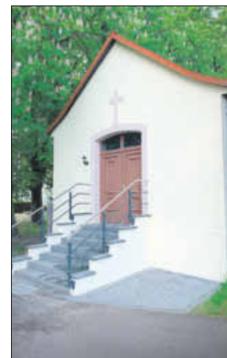
Friedhof Zerben - Trauerhalle

Auch die Pflege der umliegenden Grünanlagen liegt in den Händen des Bauhofes, so wird u. a. regelmäßig Laub geharkt, Hecken geschnitten und der