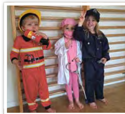
Das Erste-Hilfe-Team war vor Ort, um die Faschingsparty zu sichern.