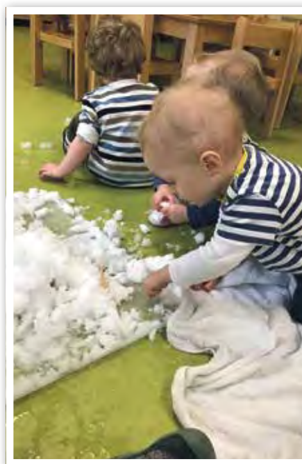
Und auch in der Kita wurde mit Schnee experimentiert.