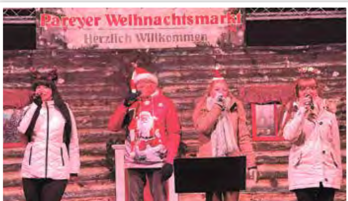
Das Jugendhaus Parey mit dem Ensemble „ICE CREAM live“ bot ein tolles Weihnachtsprogramm.