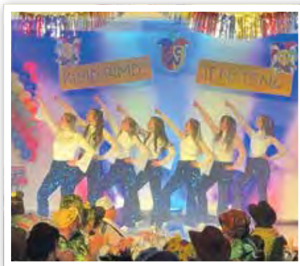
Die „Delicious“-Tänzerinnen beim Karnevalsauftakt des CCW im Lindenhof.

solche Erlebnisse für die jungen Teilnehmenden sind.