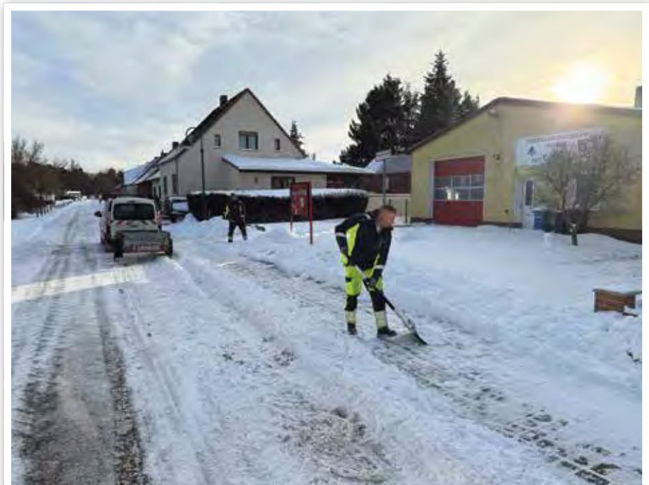
Für die Gehwege war Muskelkraft gefragt. Vielen Dank für euren Einsatz!

um die Infrastruktur unserer Gemeinde nachhaltig zu sichern und zu verbessern. Der Bauhof leistet damit einen unverzichtbaren Beitrag für das tägliche Leben in unserer Gemeinde. Für diesen Einsatz – bei jedem Wetter und oft im Hintergrund – sprechen wir allen Mitarbeiterinnen und Mitarbeitern unseren herzlichen Dank und unsere Anerkennung aus.