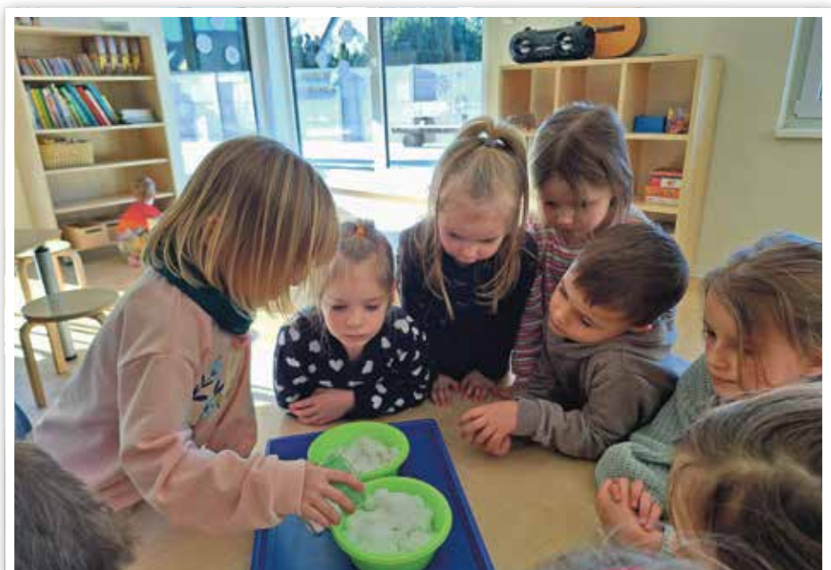
Ein Experiment durfte auch nicht fehlen.