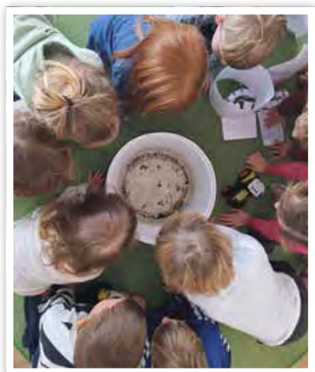
Die Kinder waren überrascht, was im Schnee so alles versteckt ist.

wachsenen eigentlich Salz auf die Straßen und Wege? Kinder wollen die Welt, in der sie leben, verstehen und gestalten. Sie erkunden sie aktiv. Also suchten wir gemeinsam nach Antworten für all die offenen Fragen. Die Art und Weise, die winterliche Welt und ihre Phänomene zu betrachten, Gesetzmäßigkeiten, Gleichheit und Unterschiede zu erkennen oder Vermutungen aufzustellen, ist Mathematik und Naturwissenschaft – einer der sieben Bildungsbereiche unseres Bildungsprogramms Sachsen-Anhalt: „Bildung: elementar – Bildung von Anfang an“. Das Bildungsprogramm ist die Arbeitsgrundlage der pädagogischen Mitarbeiter und Mitarbeiterinnen in den Kindertageseinrichtungen, denn Bildung beginnt nicht erst mit dem Schuleintritt. Auf unserer winterlichen Erkundungstour wurden neben den Bereichen der Mathematik und Naturwissenschaft