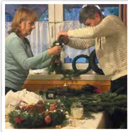
Es wurde geschnitten, gesteckt und geklebt und Kreatives für die Adventszeit gebastelt.