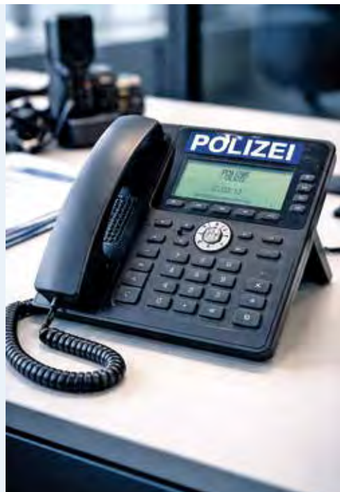
Abbildung: KI-generiert mit ChatGPT (OpenAI)

Außerhalb der Dienstzeiten oder während eines Einsatzes, sind die Polizeidienststellen in Burg (03921-9200) oder Genthin (03933-9550) Ansprechpartner.