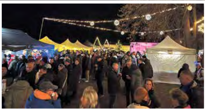
Der Kirchplatz in Parey bietet jedes Jahr die traumhafte Kulisse für den Weihnachtsmarkt.

Der Weihnachtsmarkt war nicht nur ein Fest der Lichter, sondern vor allem ein Fest der Begegnung – ein Ort, an dem man zusammenkam, ins Gespräch kam und gemeinsam die Vorfreude auf das Weihnachtsfest genießen konnte.