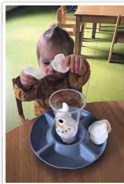
Zum Basteln nimmt man lieber den Schnee aus Watte, der schmilzt nicht.