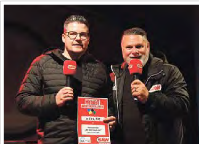
Am Ende kam eine stolze Summe für den Bau des Mehrzweckgebäudes zusammen.