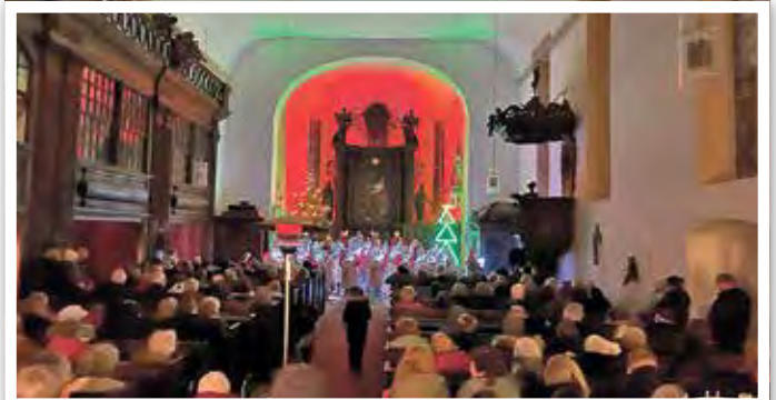
Bis auf den letzten Platz war die Kirche beim Weihnachtskonzert des Schalmeyenorchesters gefüllt.