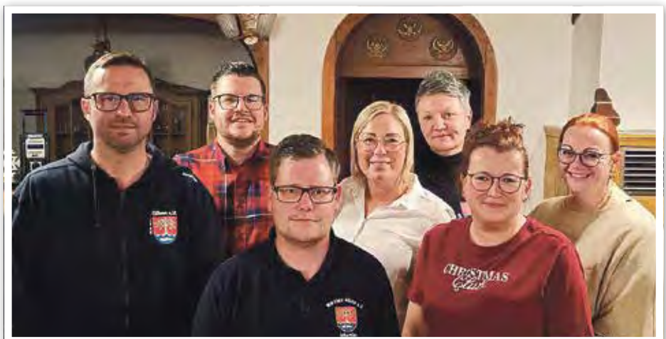
Der neu gewählte Vorstand des Heimatvereins „Wir sind Güssen“ e. V.