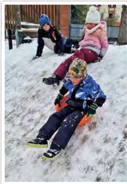
Mit Freude wurde gerutscht und getobt!