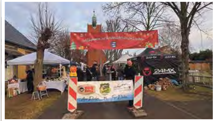
Der Heimatverein, der Angelverein und BBQ-Verein luden gemeinsam zur 3. Weihnachtsstraße ein.