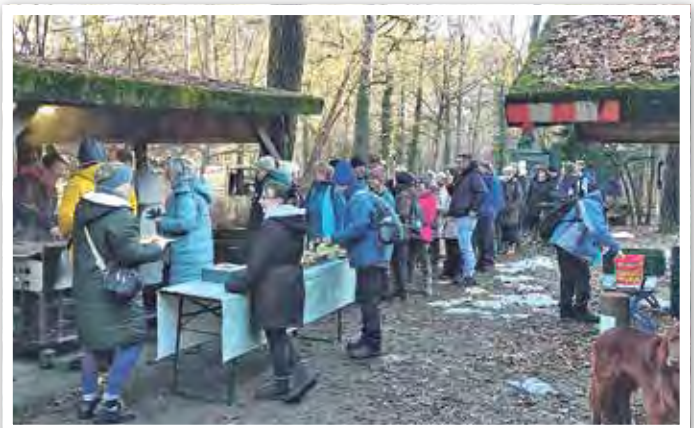
Den deftigen Kassler mit Grünkohl hatten sich alle Teilnehmerinnen und Teilnehmer redlich verdient.