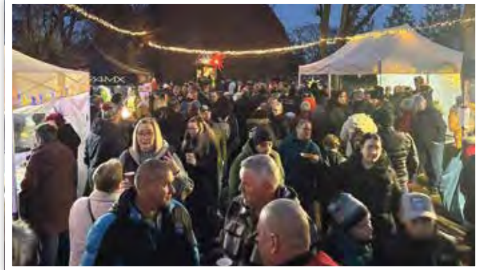
Zahlreiche Stände mit Heißgetränken, Leckereien und Geschenkideen warteten auf die Besucher.

» Zum dritten Mal veranstalteten der Heimatverein, der Angelverein sowie der BBQ-Verein am 20.12.2025 gemeinsam die Weihnachtsstraße in Derben. Zahlreiche Besucher aus der Einheitsgemeinde Elbe-Parey und darüber hinaus erlebten einen stimmungsvollen Nachmittag und gemütlichen Abend voller Aktionen, festlicher Musik und weihnachtlicher Atmosphäre. Besondere Highlights waren der Weihnachtsmann, der auf dem Lastenrad erschien und den Kindern kleine Geschenke überreichte sowie das festliche Konzert der Schülerinnen und Schüler der Grundschule Gü-