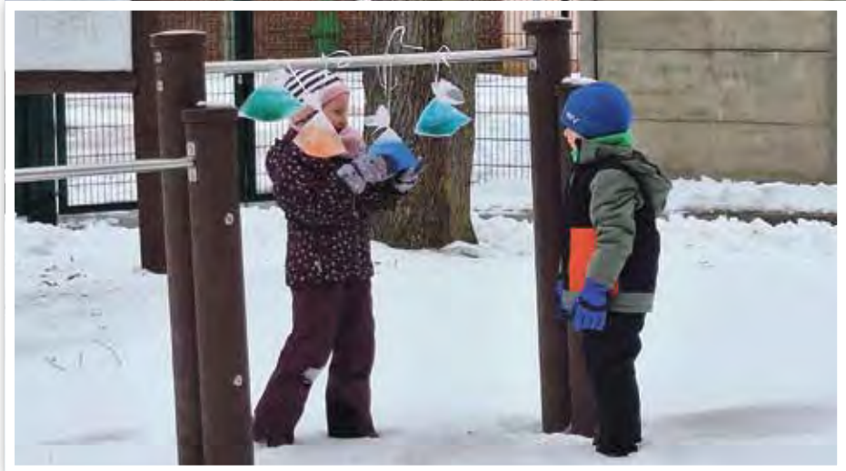
Das farbige Wasser wurde gefroren ...

Das ist ein Abenteuer für alle Großen und Kleinen. Tatsächlich konnten die Kinder den verstaubten Schlitten aus dem Schuppen holen und rodeln gehen. Sie bauten Schneemänner und -frauen oder veranstalteten eine Schneeballschlacht. Im Kindergarten wurde das wunderbare winterliche Wetter nicht nur zum Rodeln genutzt, sondern auch zum Forschen und zum Experimentieren. Denn es gab vieles zu entdecken und es stellten sich viele Fragen. Warum glitzert Schnee? Woraus besteht er und warum streuen die Er-