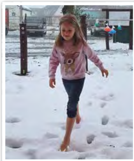
Wer ist mutig? Barfuß durch den Schnee!