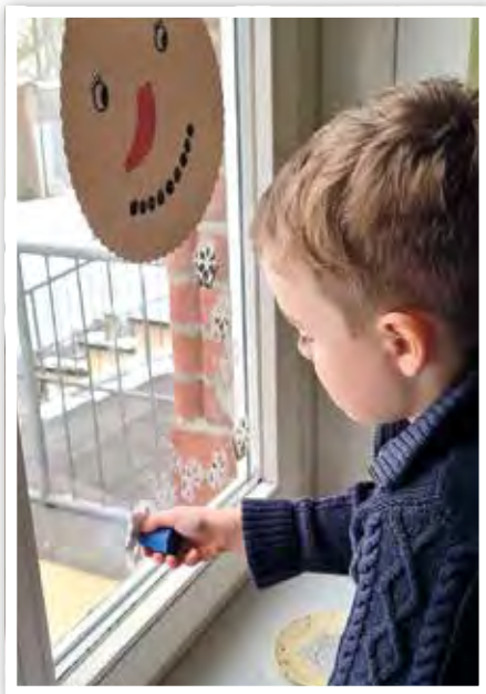
Der Winter ist da!