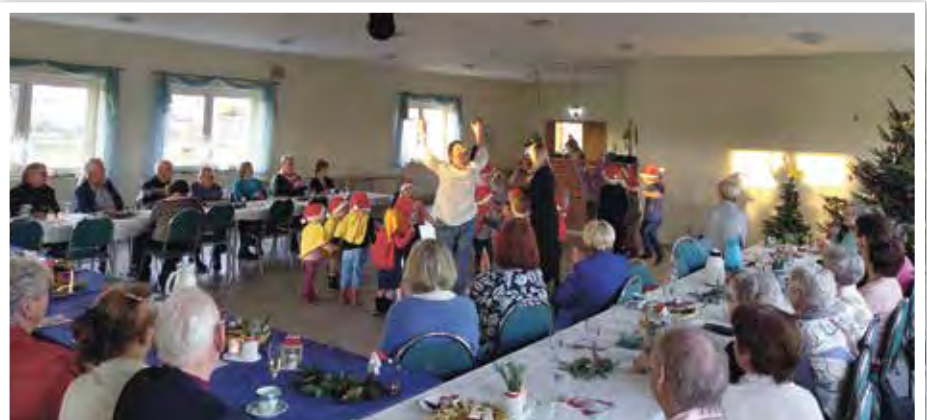
... gefolgt vom fröhlichen Weihnachtsprogramm der „Elbschlümpfe“.