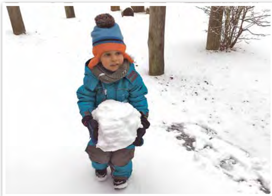
Warm eingemummelt bauten die Kinder große ...

Die Kinder und Erzieherinnen der Kita „Eulenwäldchen“ Gießen