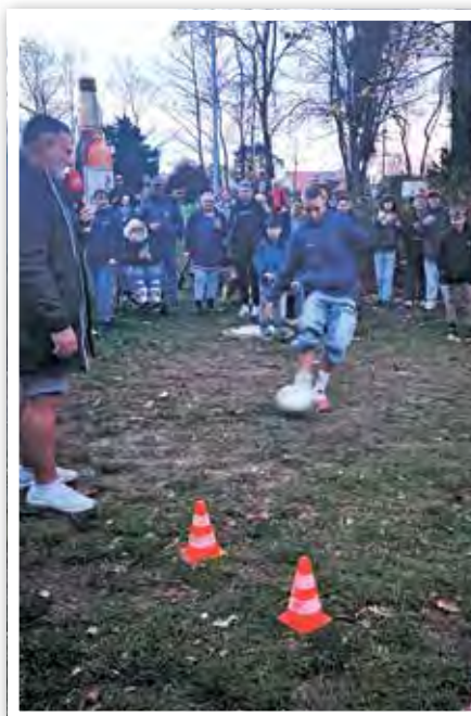
Sportliche Aktivitäten und vieles mehr standen auf dem Programm.

» Ein Tag voller Spaß, Gemeinschaft und großzügiger Unterstützung: Radio SAW machte am 13.11.2025 mit seiner Herbstmeisterschaft 2025 Halt in Güsen – und bescherte dem Ort einen unvergesslichen Nachmittag. Der Heimatverein „Wir sind Güsen“ e. V. hatte sich für die Herbstmeisterschaft beworben, um die Gemeinschaft im Ort mal wieder aufleben zu lassen und zu stärken. Mit Erfolg: Zahlreiche Besucher strömten auf das Gelände der Freilichtbühne und füllten es mit Leben. Gemeinsam mit der IKK gesund plus reiste das Team von Radio SAW an – im Gepäck alles, was man für ein gelungenes Fest braucht: Halberstädter Bratwürste, Sandtaler und Getränke wurden kostenlos ausgegeben. Für alkoholische Getränke zahlten die Gäste einen „provisorischen Euro“. Dieser kleine Beitrag floss am Ende vollständig in die Spendenkasse für das geplante Mehrzweckgebäude auf der Freilichtbühne. Natürlich standen auch die traditionellen