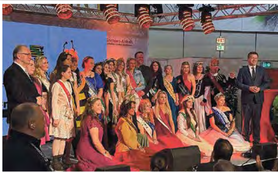
Zahlreiche gekrönte Häupter aus dem ganzen Bundesland bereicherten das Bühnenbild zum Sachsen-Anhalt-Tag.