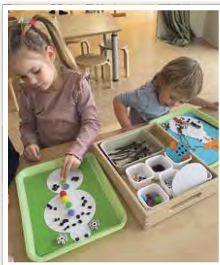
... und auch Drinnen wurde der Winter kreativ in Szene gesetzt.