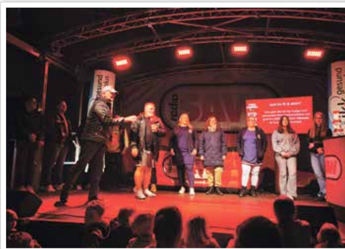
Das Gewinnspiel machte gleich 3 Besucher glücklich.