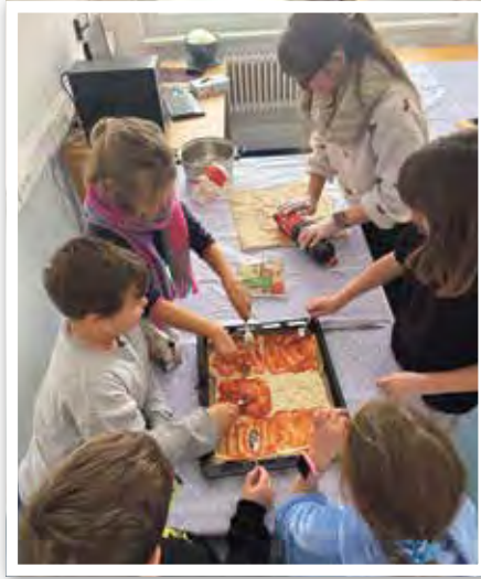
Beim gemeinsamen Pizzabacken war Kreativität gefragt.