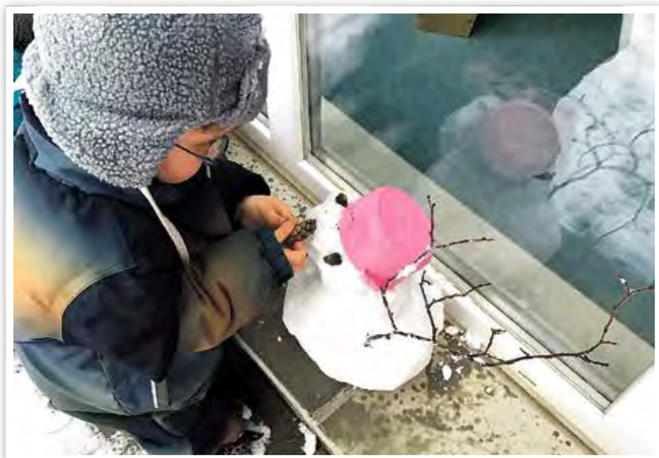
... und auch kleinere Schneemänner.