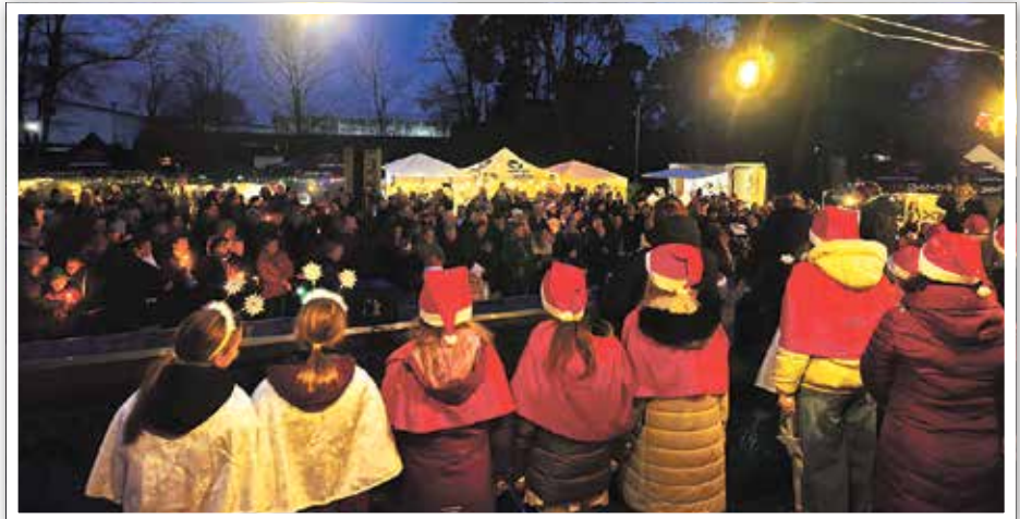
Kinder aus Kita und Grundschule verzauberten mit ihrem Weihnachtsprogramm

» Ein stimmungsvoller Abend voller Musik und Gemeinschaft: Das Weihnachtssingen auf der Güsener Freilichtbühne lockte zahlreiche Besucher an und sorgte für eine rundum festliche Atmosphäre. Der Heimatverein „Wir sind Güssen“ e. V. als Veranstalter zeigte sich überwältigt von dem großen Andrang. Mit so vielen Gästen hatte man im Vorfeld nicht gerechnet. Umso größer war die Freude darüber, wie viele Menschen gemeinsam kamen, um sich auf die Weihnachtszeit einzustimmen. Ein besonderer Dank gilt den Sponsoren, die diese Veranstaltung ermöglichten, dem engagierten Chor des Vereins, der mit seinem Gesang für musi-