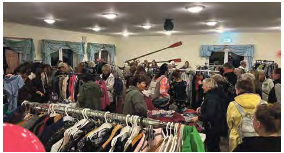
Der große Andrang zeigt, dass die Veranstaltung rundum gelungen ist.