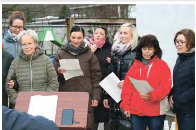
Das selbstgedichtete Abschiedslied ließ sogar Tränen fließen.