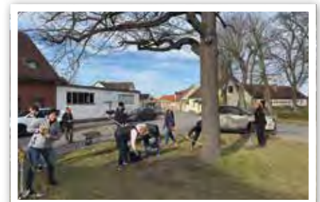
Im letzten Jahr kümmerten sich Mitglieder des Heimatvereins Parey e. V. sowie des Moskito Club e. V. u. a. um den Platz an der Kircheneiche.

Jede helfende Hand zählt – ob groß oder klein. Gemeinsam sorgen wir für ein sauberes, schönes Parey und stärken dabei den Zusammenhalt in unserer Gemeinde.