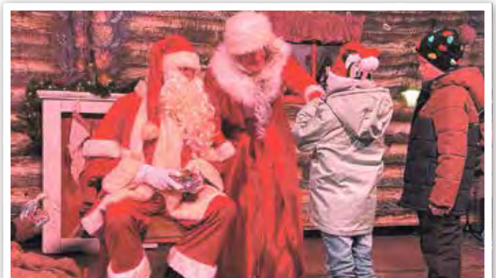
Weihnachtsmann und Weihnachtsfrau waren gekommen, um die Kinder zu beschenken.