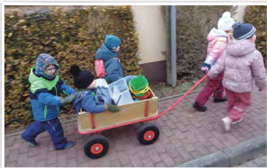
Auf Tour zum Bauernhof.

Mit winterlichen Grüßen von den Kindern und Erzieherinnen der Kita „Sonnenwinkel“ in Bergzow