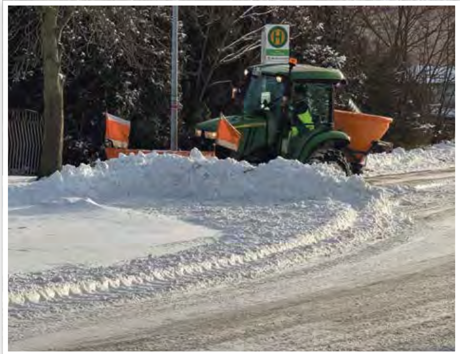
Mit dem großen Schiebeschild am Traktor wurden Straßen, Gehwege und Haltestellen beräumt.

Auch im Frühjahr, Sommer und Herbst war das Team unseres Bauhofes wieder in vielfältiger Weise für die Gemeinde im Einsatz. Mit großem Engagement, handwerklichem Können und viel Einsatzbereitschaft haben die Mitarbeiter dafür gesorgt, dass unsere Ortsteile sicher, gepflegt und lebenswert bleiben. Es standen umfangreiche Baumschnittarbeiten an. Diese dienen nicht nur der Pflege des Ortsbildes, sondern auch der Verkehrssicherheit und dem Erhalt des Baumbestandes. Ein bedeutendes Projekt war die Durchführung von Pflasterarbeiten an der neuen Kita in Derben. Sowohl die Einfahrt, als auch Parkplatzflächen wurden fachgerecht hergestellt und tragen nun zu einer sicheren und ordentlichen Umgebung für Kinder, Eltern und Personal bei. Somit gehen wir der Eröffnung der neuen Kita mit einem weiteren großen Schritt entgegen. Zu den regelmäßigen Aufgaben gehörten zudem die Mäharbeiten auf öffentlichen Grünflächen sowie die Pflege von Anlagen im gesamten Ge-