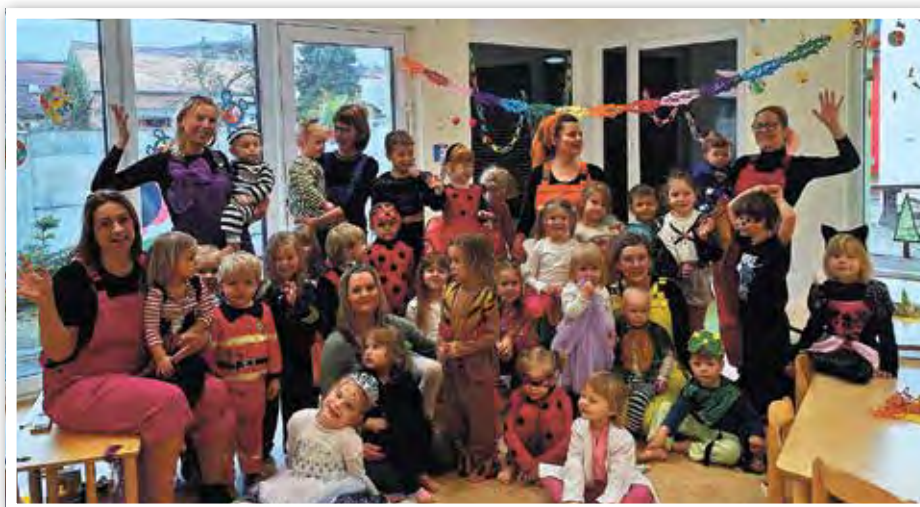
Alle Strolche haben sich mit ihren Kostümen große Mühe gegeben ...