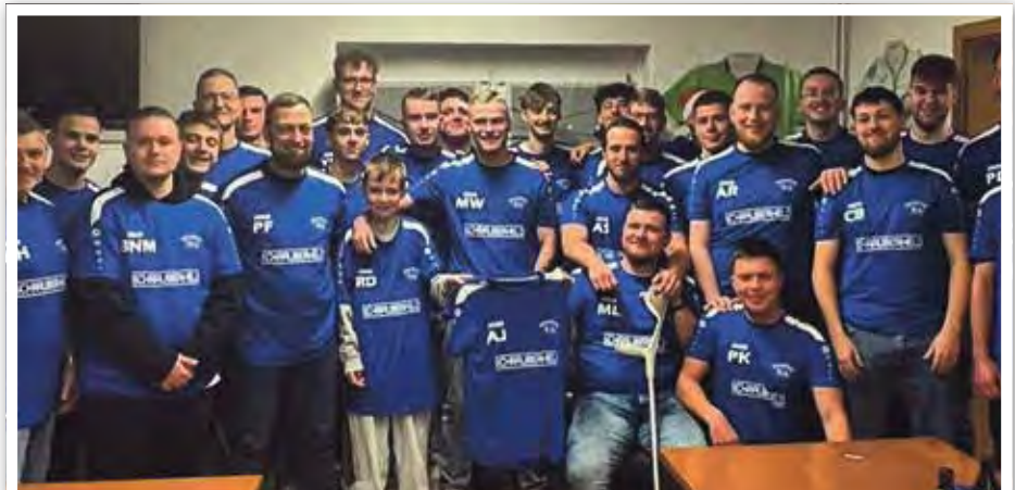
Die Männer freuen sich über die neuen Shirts zur Aufwärmung.