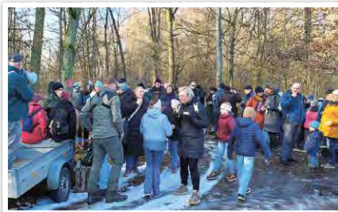
Insgesamt hatten sich 145 Wanderfreudige aufgemacht, um in geselliger Runde die knapp 9 km lange Strecke zu bewältigen.