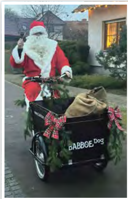
Der Weihnachtsmann kam mit dem Lastenrad und hatte Überraschungen für die kleinen Gäste im Gepäck.

letzte Geschenke für das bevorstehende Weihnachtsfest zu besorgen: duftendes Parfum, individuelle Präsente von Kränzchentee aus Zerben oder der Heimatkalender aus Derben waren beliebte Mitbringsel. Ein herzliches Dankeschön geht an alle Beteiligten für die tolle Zusammenarbeit innerhalb des Ortes, der ansässigen Vereine und aus verschiedenen Teilen der Gemeinde Elbe-Parey. Schon jetzt freuen wir uns auf die nächste Weihnachtsstraße, die traditionell am Vorabend des 4. Advents am 19.12.2026 stattfinden wird.