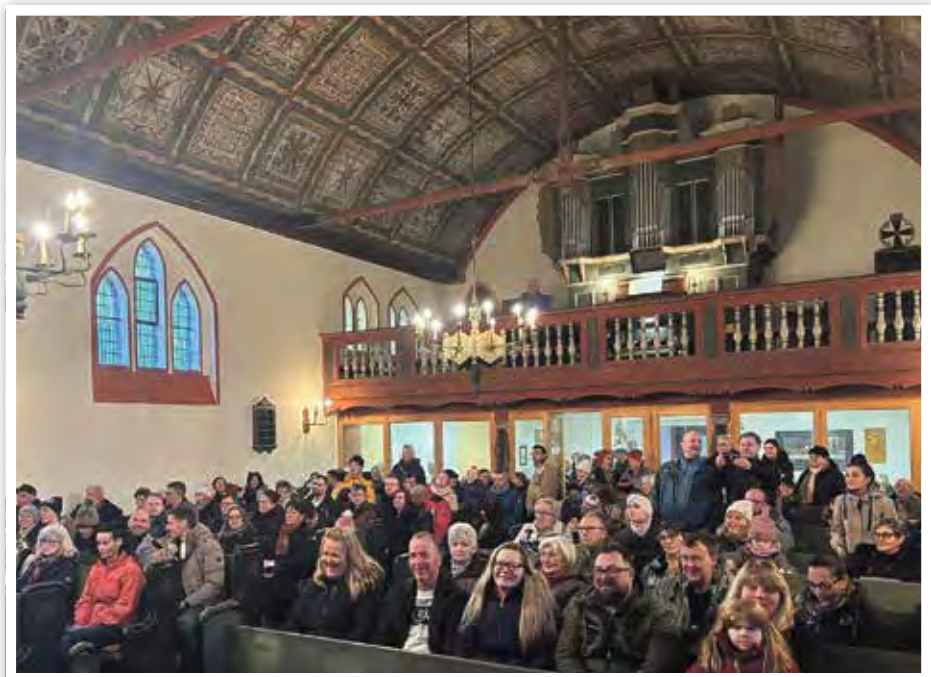
In der Kirche sorgte das Konzert der Güsener Schülerinnen und Schüler für Gänsehaut.