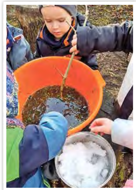
Spannende Experimente mit Eis und Schnee.

» Wenn der Winter Einzug hält, wird es in der Kita „Sonnenwinkel“ besonders lebendig. Die kalte Jahreszeit nutzen wir, um den Schnee mit allen Sinnen zu entdecken und kreativ zu werden. Schon drinnen sorgte der Winter für leuchtende Augen. Mit viel Freude druckten die Kinder Schneemänner an die Fensterscheiben und verwandelten die Räume in eine winterliche Landschaft. Schritt für Schritt entstanden außerdem gemalte Schneemänner, bei denen jedes Kind seine eigenen Ideen und Fantasien einbringen konnte. Mit viel Kreativität gestalteten sie eigene Wintermützen und Handschuhe. Dabei entwarfen sie bunte Muster und fädelten Perlen auf. Eine spielerische Übung, die ganz nebenbei die Feinmoto-