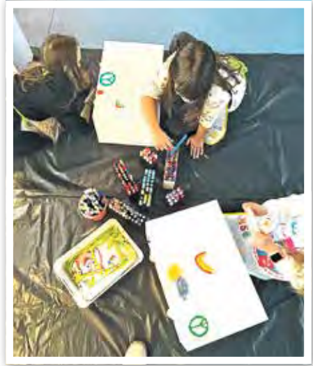
Internationalen Woche gegen Rassismus: Kinder gestalteten Bausteine zum Thema Frieden und Gemeinschaft