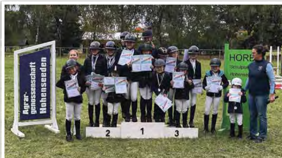
Alle geehrten Teilnehmerinnen der Kreis Kinder- und Jugendspiele.